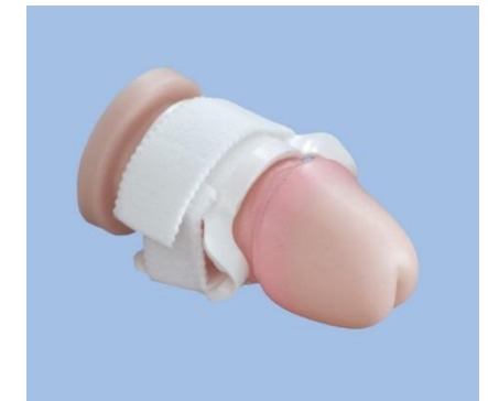
So ist C3® richtig angelegt!

Niemals mit geschlossenem C3® System urinieren!